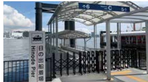
18:00になりましたら船着場前に集合